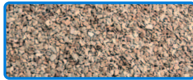
ABSO'NET SUPERIOR SPECIAL 0,6 - 1,3 mm

TYP III R MPA GEPRÜFT NF P98-190 GEPRÜFT