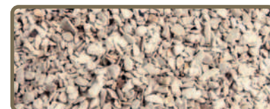
ABSO'NET ONE SPECIAL 0,6 - 1,3 mm