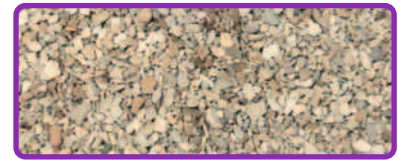
ABSO'NET SUPERIOR PLUS 0,6 - 3,4 mm

TYP III R MPA GEPRÜFT NF P98-190 GEPRÜFT