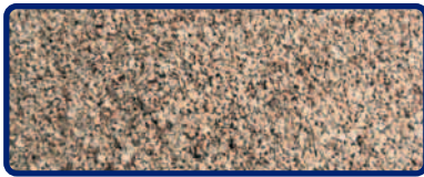
ABSO'NET SUPERIOR XTRA 0,3 - 0,9 mm

TYP III R MPA GEPRÜFT NF P98-190 GEPRÜFT